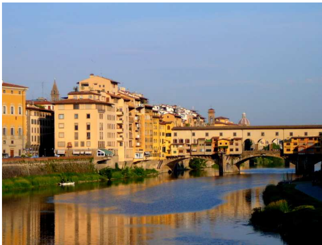
Firenze (Ponte Vecchio)

Szemléltetésként mellékelek fotókat az utazásról.