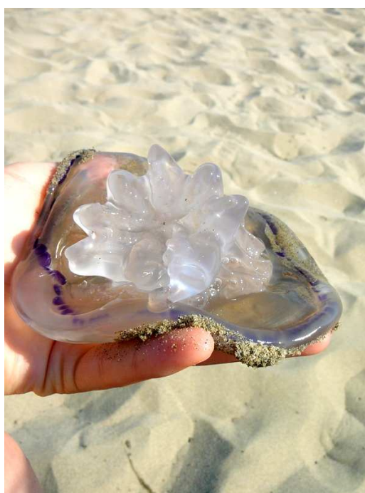
medúza a Viareggio-i tengerparton