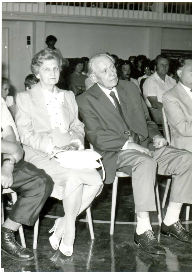
3. ábra 80. születésnapján feleségével a Gimnázium tornatermében (1987)